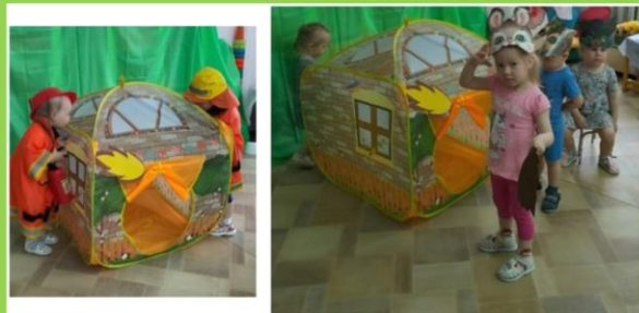
Драматизация сказки «Кошкин дом»